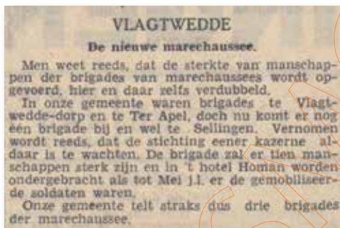
Nieuwe Prov. Groninger Courant, 23 augustus 1940

Bij de Duitse inval op 10 mei 1940 worden de wegen rondom Hoorn afgesloten met versperringen en verdedigingsposities ingericht. Op de tweede oorlogsdag krijgt het depotbataljon - geheel onvoorbereid - de zorg voor zo'n duizend opgepakte NSB'ers, die in de voormalige gevangenis worden ondergebracht. Op 14 mei ontvangen de depottroepen de opdracht om de lijn IJmuiden - IJsselmeerkust (het noordfront van de Vesting Holland) te betrekken, maar 's avonds maakt de radio bekend dat Nederland heeft gecapituleerd. Het leger wordt gedemobiliseerd, soldaat De Ruiter gaat op 15 juli met groot verlof en keert naar huis terug.